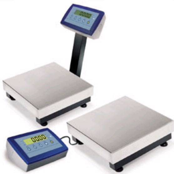
EPQ30 cu sau fără picior TQNC